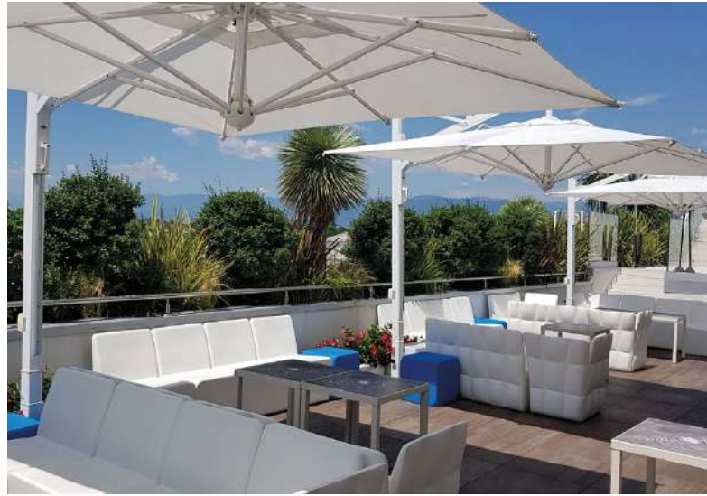
TERRAZZA MOVIDA CASTIGLIONE DI LORIA - TREVISO