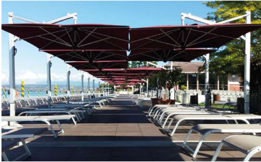
TERME DI SIRMIONE - BRESCIA